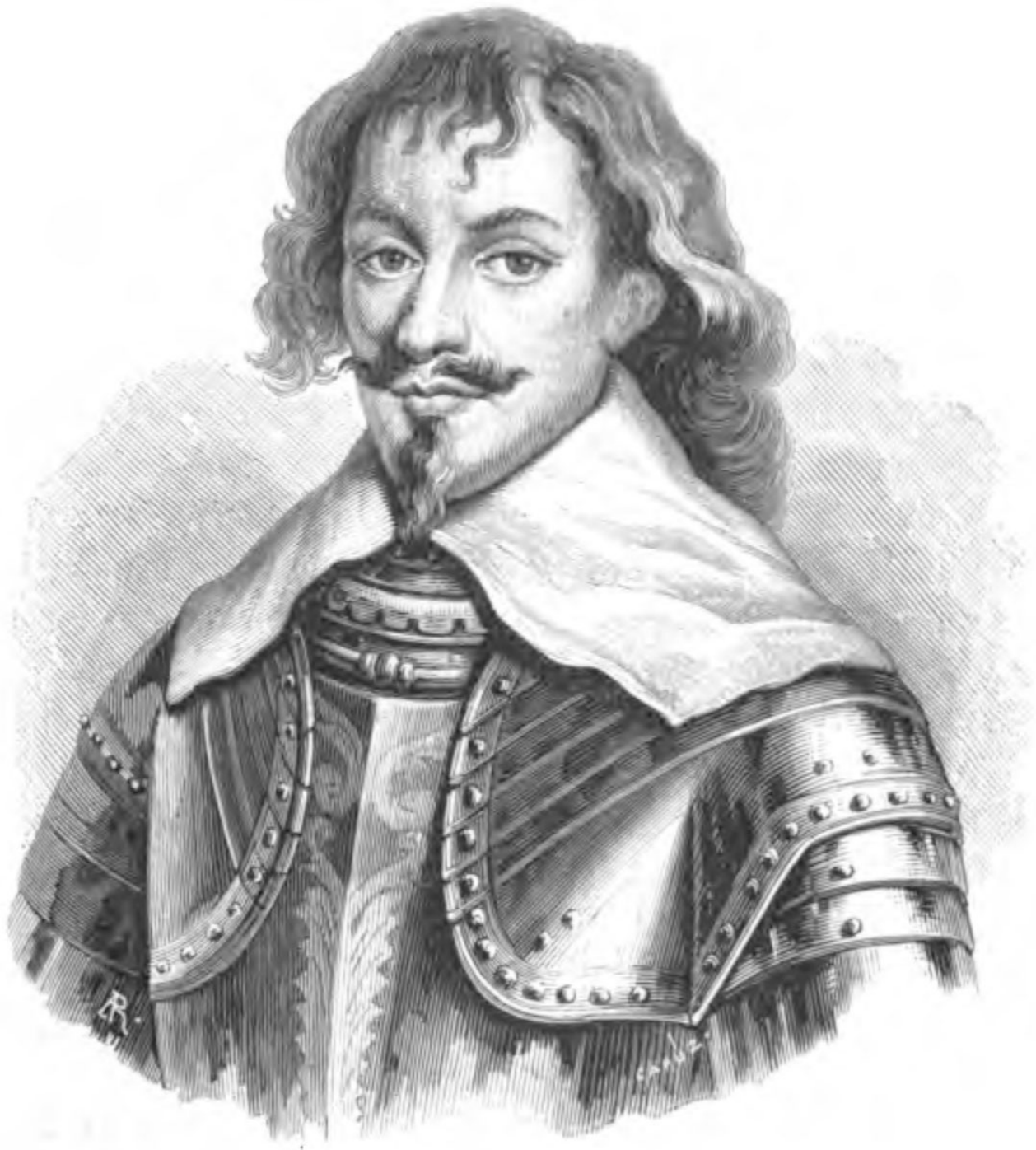
EL CONDE DE WARWICK

Ambos ejércitos pasaron la noche en el campo de batalla, ambos inquietos por el día siguiente y atribuyéndose la victoria. El parlamento había perdido más soldados, y el rey más oficiales y jefes distinguidos. Al amanecer Carlos recorrió su campamento; faltaba un tercio de infantería y muchos caballeros, no porque hubiesen perecido todos, sino porque el frío, la falta de víveres y el terror del primer choque habían dispersado a muchos voluntarios. Para continuar libremente su camino sobre Londres, quería el rey trabar una nueva refriega; pero pronto conoció que era excusado intentarlo. Agitábase la misma cuestión en el campo enemigo; Hampden,