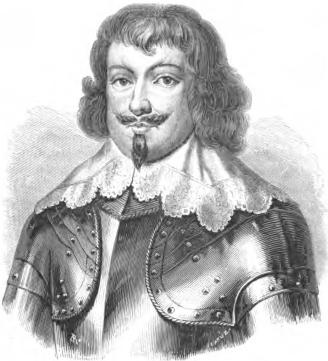
EL CONDE DE ESSEX

de Inglaterra. Entre los debates de ambos partidos en el seno del parlamento, y su choque a mano armada en los campos de batalla, se interpuso por decirlo así durante algunos meses el raciocinio y la ciencia, suspendiendo el curso de los acontecimientos, desarrollando sus más hábiles esfuerzos para granjearse la libre adhesión de los pueblos, y queriendo dar a una y otra causa el carácter de la legitimidad.