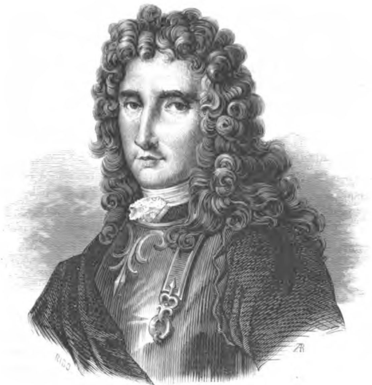
EL DUQUE DE HAMILTON