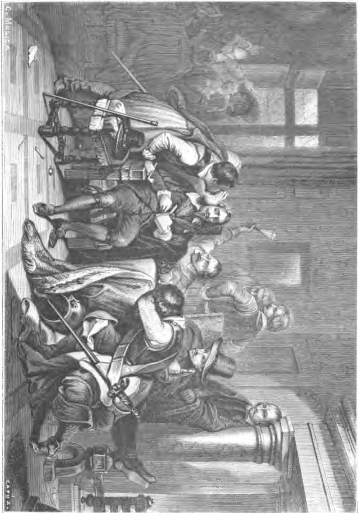
INSULTOS PRODIGADOS A CARLOS I

Carlos apareció vencido y sólo insistió débilmente: