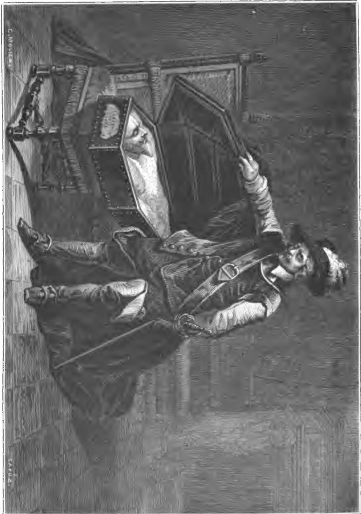
CROMWELL MIRANDO ATENTAMENTE EL CADÁVER DE CARLOS I

Juxon: Si señor, sólo hay un paso que dar; está lleno de turbación y agonía, pero es breve y pensad que ganáis mucho con él; os hace pasar de la tierra al cielo.